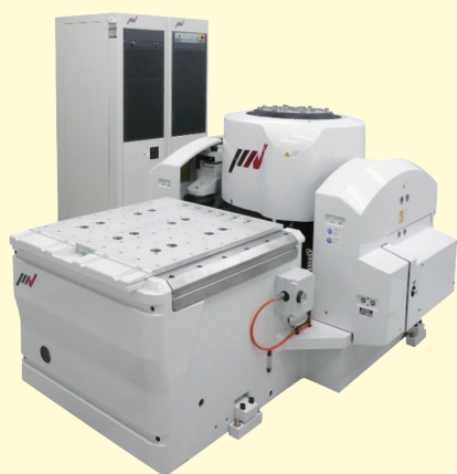
【対応機種】 複合振動試験機 IMV社製 A45

※複数回のご利用で長期間になる場合でも、内容に応じて割引も検討いたしますのでご相談ください。