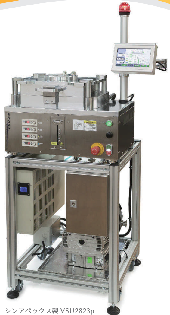
シンアペックス製 VSU2823p