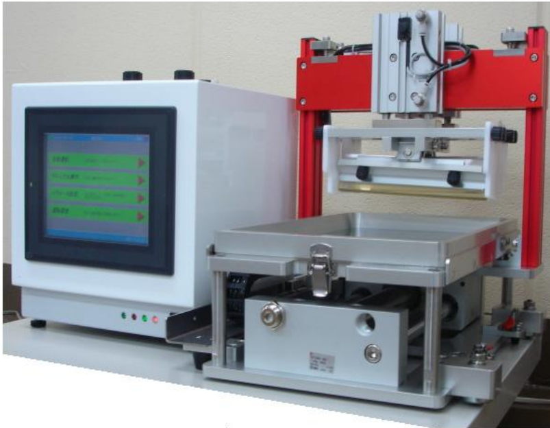
はんだペーストの試験風景